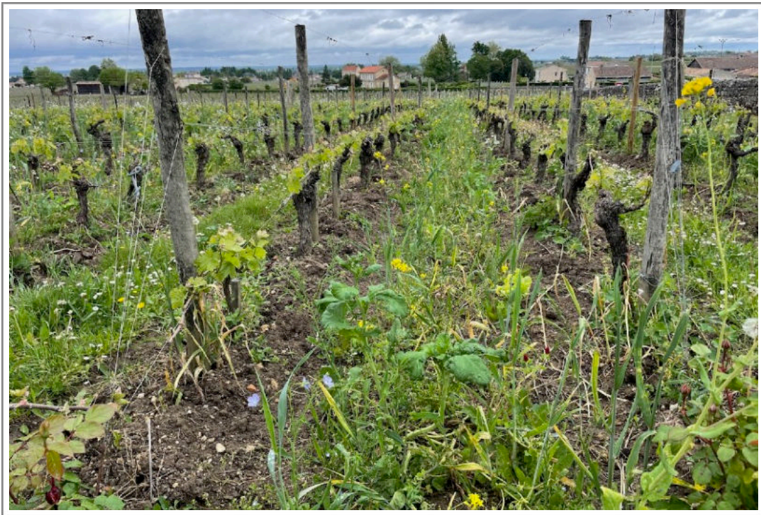
Clos Fourtet, 26 april 2023

Pessac Léognan rouge — Carmes Haut Brion , Haut-Bergey , Domaine de Chevalier, Haut Bailly en Haut-Bailly II , Smith Haut Lafitte en Petit SHL, Latour Martillac, Branon