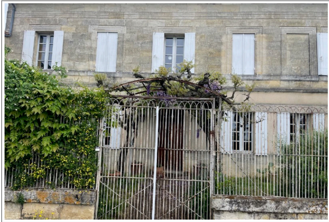
Château l'Eglise Clinet, 27 april 2023

De zomer rolde prachtig uit, met warm weer maar wel met relatief koele nachten. Dat laatste heeft er mede voor gezorgd dat de druiven een, naar verhouding, goede zuurgraad behielden.