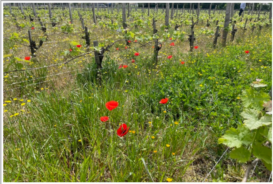
Guillot Clauzel, 27 april 2023

We hoorden meer verhalen. Vaak passen die goed naast elkaar, of zijn ze in elkaar te schuiven. Soms wat minder. Zo hoorden we: het jaar was zo rijp en compleet, we hebben weinig gedaan om de wijn te maken, we zijn heel voorzichtig geweest met de extractie om dit nobele karakter geen geweld aan te doen. Fair enough . Ergens anders hoorden we: bij een jaar als 2022 moet je ‘dieper’ gaan, anders loop je het risico een fruitbom met gebrek aan structuur te krijgen, een onevenwichtige wijn.