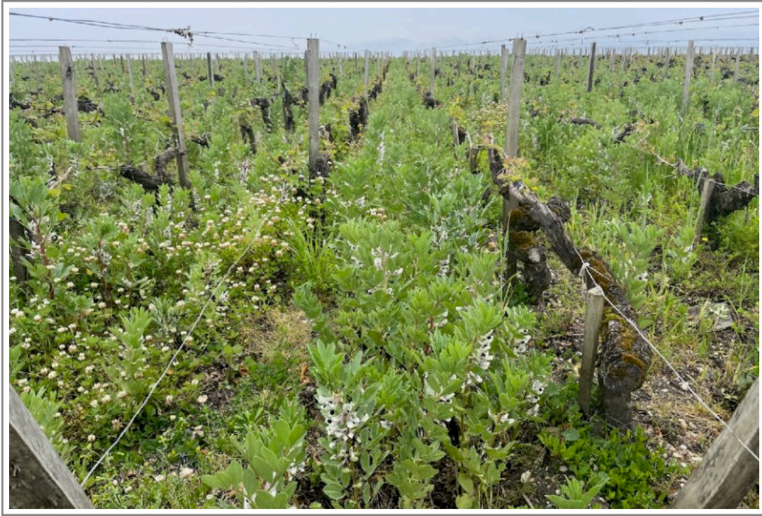
Pichon Baron, 25 april 2023

Dit jaar zijn er zowel op de linkeroever als op de rechteroever geweldige wijnen gemaakt. En dat is voorzichtig uitgedrukt. Ik heb weer hetzelfde gevoel als toen