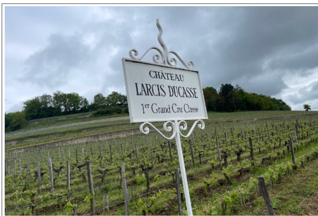
Larcis Ducasse, 26 april 2023

De winter was redelijk normaal zij het iets minder koud en iets minder nat dan gemiddeld. In de voorgaande jaren was het steeds spannend in april, en ook dit jaar was er vorst in de ochtend. Maar dat was vroeg in de maand, en lokaal, en de schade was maar heel beperkt. Daar gaat het duidelijk niet over dit jaar.