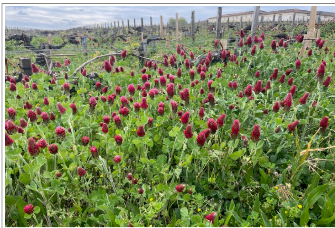
Wijngaard van Latour, 24 april 2023

Ook de planten lijken niet meer dezelfde. Nu is dat voor een deel ook waar: ze zijn of 20 jaar ouder, of ze zijn nieuw. Maar los daarvan ziet het ernaar uit dat de planten zich hebben weten aan te passen aan de huidige warmere zomers. De mens helpt natuurlijk waar mogelijk, bijvoorbeeld door op andere tijden te snoeien, en anders te snoeien. En (on)kruid te laten staan.