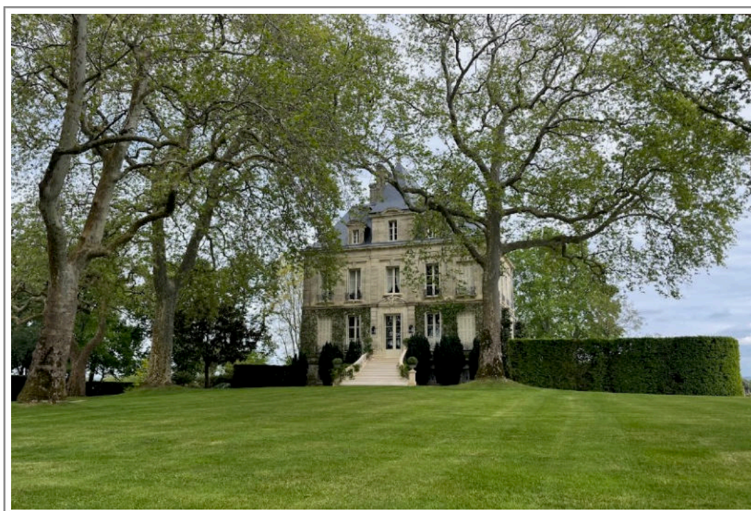
Château Latour, 24 april 2023

We zijn nu twee decennia verder en opnieuw ziet een zeer warm oogstjaar het levenslicht: Bordeaux 2022. Maar overeenkomsten met het hittejaar 2003 zijn er maar heel beperkt. Gelukkig maar.